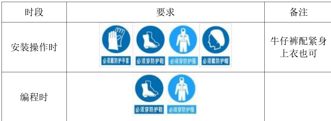
表5选手防护装备佩带要求

大赛时，裁判员对违反安全与健康条例、违反操作规程的选手和现象将提出警告并进行纠正。不听警告，不进行纠正的参赛选手会受到不允许进入竞赛现场、罚去安全分、停止加工、取消竞赛资格等不同程度的惩罚。选手防护装备佩带要求见表5。