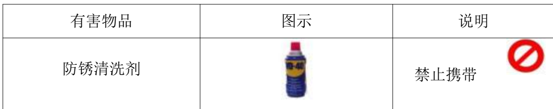
表6选手禁带的物品